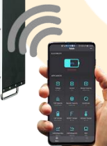
Sistema Genius Kompact