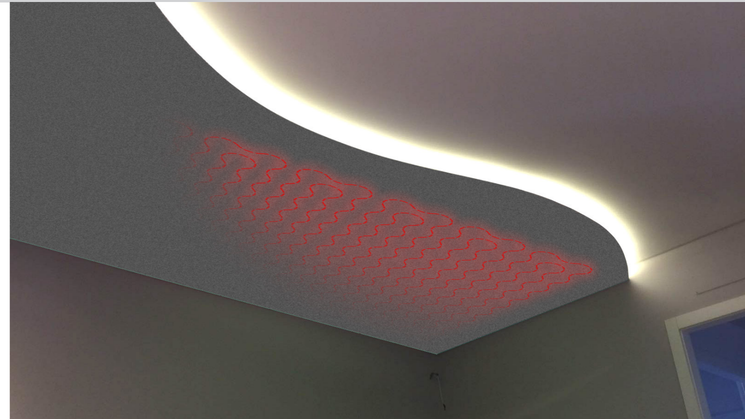
Esempio di veletta radiante realizzata con FinoTherm PREFINITO.

Disponibile anche con pannelli isolanti VIP