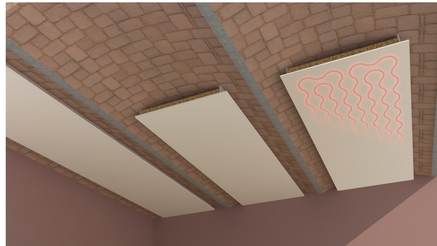
FinoTherm PREFINITO come elemento radiante posto all'intradosso di voltine il laterizio.